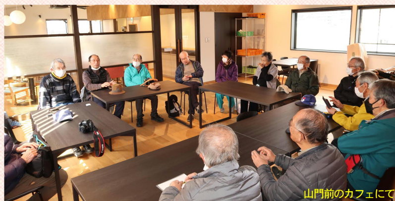
山門前のカフェにて

桜の方は、各個人の都合がつく時間にお気に入りの場所などで自由に撮影して下さい。その作品と今回の梅の撮影会での作品と併せて、5月中頃に開催予定の「作品交流・発表会」に向けた御準備をお願いします。