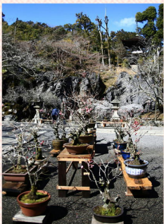
観音堂の前の盆梅