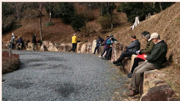
昼食風景(見事なソーシャル・ディスタンスです!)