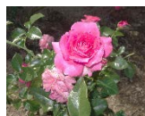
写真は昨年秋の一般公開のもの