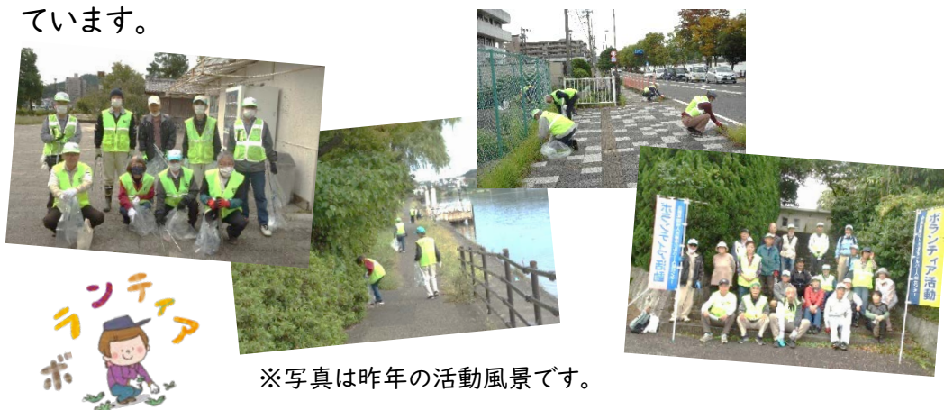
※写真は昨年（2022年）の活動風景です。

昨年は、146名の会員の方が参加されました。本年も数多くの皆さんの参加をお待ちしています。