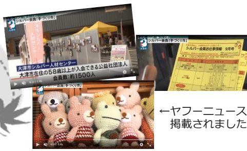
←ヤフーニュースに 掲載されました♪

9月24日、25日の両日、 brunch大津京で「Make 2nd Life 2022 入会説明会」を開催しました。数多くの方にご来場いただき、大津市シルバー人材センターを身近なものに感じていただける機会にすることができました。開催にあたりましてご協力いただきました皆さまに心より感謝申し上げます。センターホームページのお知らせにも掲載していますのでご覧ください。